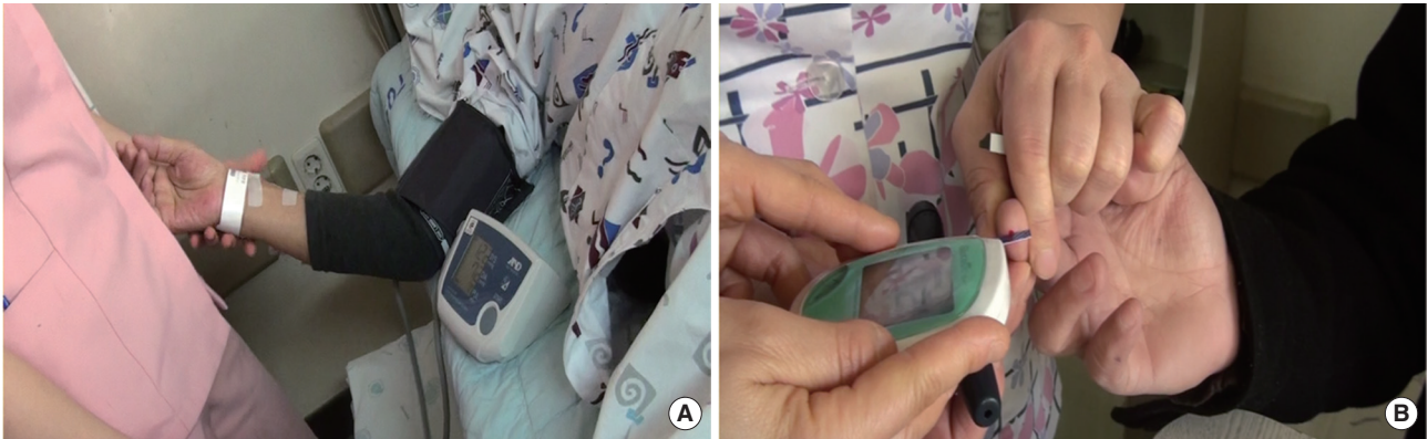
Figure 2. Clinical trial process. (A) Measurement of blood pressure. (B) Measurement of blood glucose.